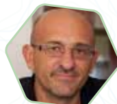
Camillo Botticini, Architetto - Studio Botticini + Facchinelli Architectural Research | Workshop